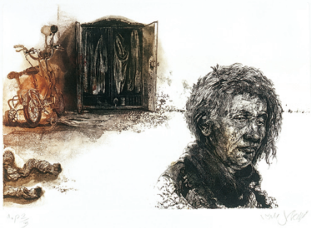
55x75 cm/Calcography on hand-made 100% Cotton 400gr. Arch-cardboard