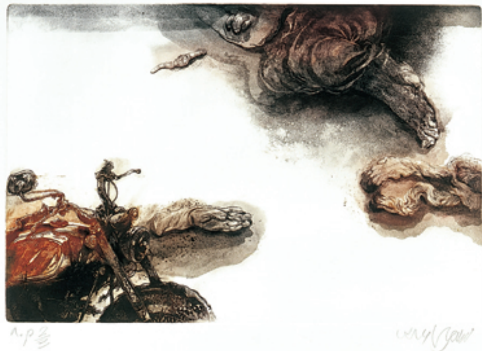
55x75 cm/Calcography on hand-made 100% Cotton 400gr. Arch-cardboard