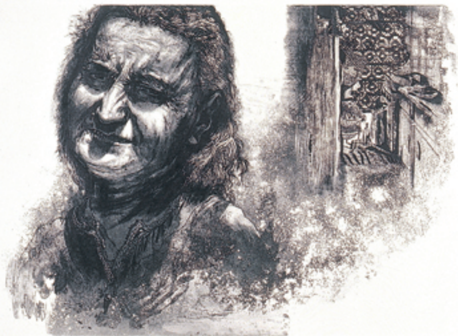
55x75 cm/Calcography on hand-made 100% Cotton 400gr. Arch-cardboard