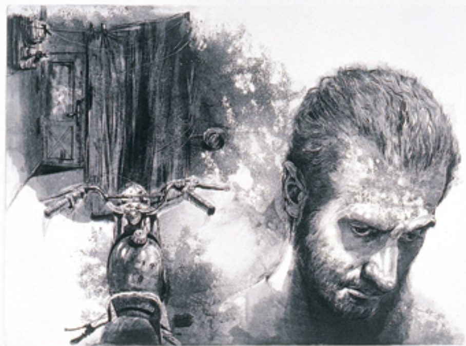
55x75 cm/Calcography on hand-made 100% Cotton 400gr. Arch-cardboard